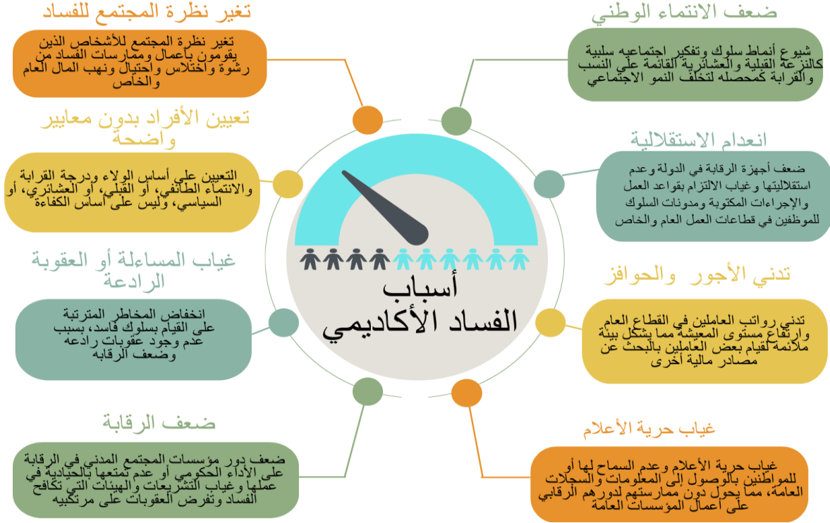
الشكل (2): أسباب الفساد الأكاديمي