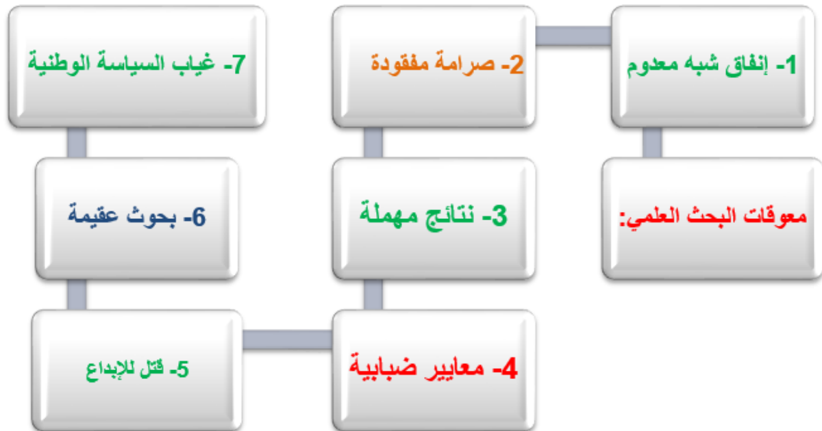
شكل (1) معوقات البحث العلمي في فلسطين والوطن العربي

إن قطاع البحوث العلمية لا يزال يفتقر إلى الحوكمة والتنظيم المناسبين، وإلى وجود سياسات واستراتيجيات واضحة، إلى جانب تغييب الدور التنموي للبحث العلمي في السياسات والاستراتيجيات الوطنية، والخطط التنموية، إذ لا توجد استراتيجيات وخطط عمل مرحلية واضحة للتنفيذ لاستراتيجيات الكثير من المؤسسات، إضافة إلى عدم تحديد الأولويات التي يجب أن توضع في مقدمة برامج القطاعات العلمية المختلفة. (ماس، 2022: 14)