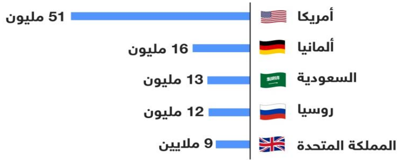
شكل 2 أعلى الدول استضافة للمهاجرين وعدد المهاجرين إليها.

إن استنزاف العقول عادة ما تتم بين الدول المتخلفة (الفقيرة) (والدول المتقدمة (الغنية)؛ حيث أن عملية استنزاف العقول الكفاءة تسير دائماً باتجاه واحد أي منها إلى صالح الدول المتقدمة وبدرجة أقل إلى دول نامية أخرى وطبقاً للإحصائيات الأمريكية للفترة ما بين 1960-1987 فقد شهدت الولايات المتحدة الأمريكية هجرة أكثر من 850 ألف كفاءة علمية من الدول النامية. والجدول التالي يبين حركة وانتقال المهارات العربية إلى دول منظمة التعاون الاقتصادي لعام 2000. 6