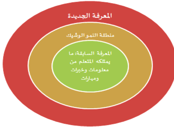
شكل (٢): منطقة النمو الوشيك عند فيجوتسكي (Ali, ٢٠١٧, p.١٧)

ومن أهم مميزات الدعائم التعليمية أنها توفر بيئة تعليمية داعمة، ففي بيئة التعلم ذات الدعائم يتمتع الطلاب بحرية طرح الأسئلة وتقديم ملاحظات ودعم أقرانهم في تعلم مواد جديدة، كما أن دمج الدعائم التعليمية في الفصل يوفر حافزاً للطلاب ليقوموا بدور أكثر نشاطاً في تعلمهم، ويتقاسم الطلاب مسؤولية التعليم والتعلم من خلال الدعائم التي تتطلب منهم تجاوز مستويات مهاراتهم ومعرفتهم الحالية. وتأخذ الدعائم التعليمية أشكالاً عدة وفقاً للغرض الذي تهدف إليه، ولدعم الأنشطة والتخصصات المختلفة، وفيما يلي عرض لأهم هذه الأنواع: