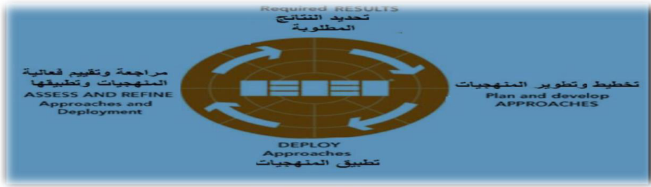
شكل (3): آلية الرادار