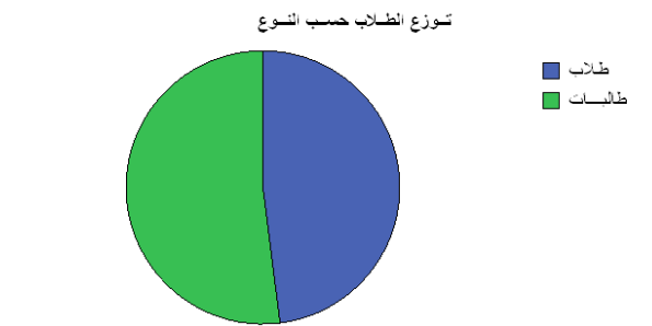
شكل (2) نسبة الطلاب الذكور إلى الطلاب الإناث ( )

من الجدول (2) بلغت نسبة الطلاب الإناث داخل العينة (52%)، بينما بلغت نسبة الطلاب الذكور (48%).