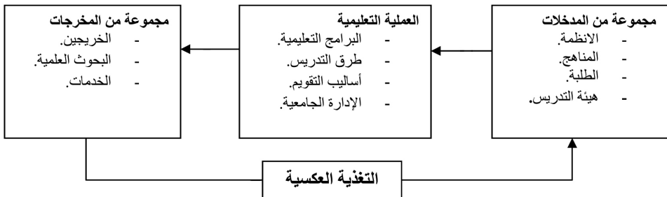
الشكل رقم 1: مكونات النظام التعليمي