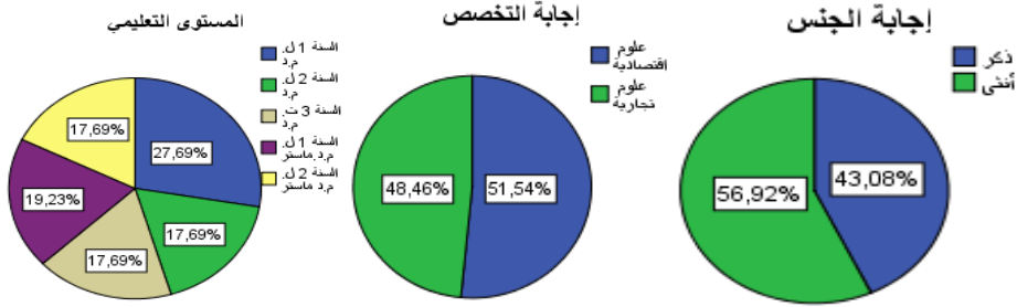
الشكل 2: توزيع أفراد العينة حسب الجنس، التخصص، المستوى التعليمي

كما اعتمدنا في تحليل الاسبان على 35 سؤالاً، تعكس عناصر المزيج التسويقي السبع التي تعرضنا إليها في الدراسة النظرية، ومحاولة معرفة مدى تأثيرها على ترقية الخدمات التعليمية، وسنقوم بتوضيح هذه العناصر فيما يلي :