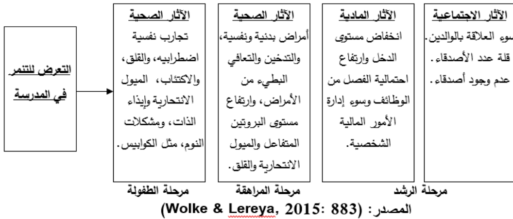
شكل (١): الآثار بعيدة المدى للتعرض للتنمر على الطلاب

يتبين مما سبق، أن الآثار المترتبة على التنمر بين الطلاب متعددة الصور والجوانب، مما يشير إلى تعقيد وتداخل تلك الآثار؛ كما ينبغي النظر بعين الإمعان إلى كون آثار التنمر بعيدة المدى، أي أن التنمر قد يؤثر على مستوى جودة حياة الفرد حتى بعد إتمام جميع مراحل التعليم العام؛ ويفرض ذلك توجيه المدارس بالغ اهتمامها بالتصدي لحالات نشوء السلوكيات التنمرية مبكراً، وذلك على أن يتم تبني منهج يقوم على معالجة احتياجات الطلاب، وبشكل خاص الضحايا، بمنظور شمولي وكلي.