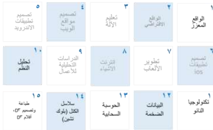
شكل (٢): مجموعة تكنولوجيا المستقبل غير المتوفرة في المناهج

ثانياً: النتائج المتعلقة بالسؤال الثاني: هل توجد أنشطة ومشاريع ريادية مخططة ومنظمة لتدريب الطلاب في مجال تكنولوجيا المستقبل بمدارس السلطنة؟