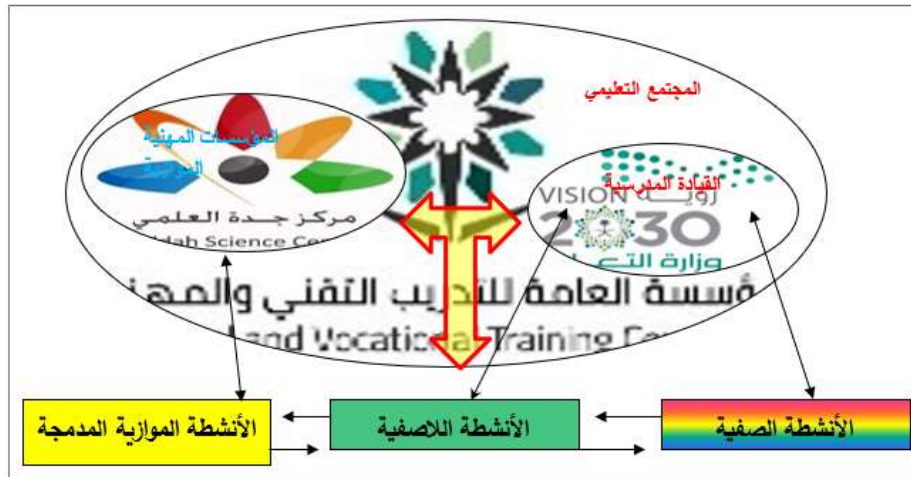
الشكل (١): أنواع الأنشطة المدرسية وتداخلاتها المكملة لبعضها البعض