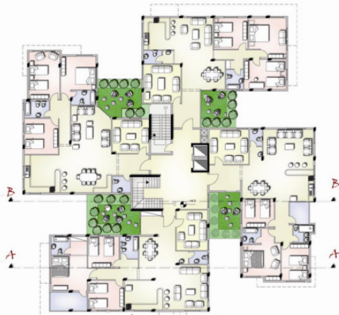
مسقط الطابق الأول

وفي سياق الحفاظ على المضمون التراثي في العمارة يظهر الشكل (١) حلاً من أحد الطالبات في المستوى الثالث لعمارة سكنية متعددة الطوابق يتضح فيه الحرص على الخصوصية للمداخل، وتوفير فكرة الانفتاح على الفناء الداخلي التراثية، حيث تم توفير مكان لشرفة متسعة تكون بمثابة حديقة خاصة صغيرة لكل شقة في كل طابق تطل عليها فراغات حيوية بالشقة.