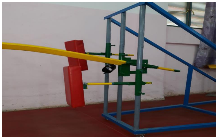
شكل (4) يوضح الاسطوانات العمودية (الاعمدة)

4- قاعدة المصد الخلفية: هي عبارة عن انبوب مجوف يدخل بداخل العمود المثبت اليمين حيث يوجد فيه اقفال عدد (2) اسفل واعلى لغرض تثبيت قاعدة المصد حسب طول اللاعب وتحتوي هذه القاعدة ايضا على انبوب مجوف مثبت على القاعدة بشكل افقي وتحتوي القاعدة على الاجزاء التالية :