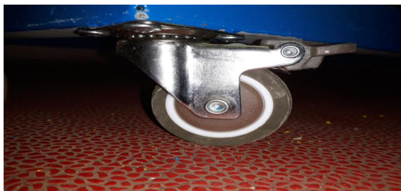
شكل (2) يوضح عجلات الجهاز

1- العجلات: يتكون الجهاز من اربعة عجلات تدور بجميع الاتجاهات حتى يسهل عملية تحريك الجهاز باتجاهات مختلفة ، وتحتوي العجلات على كوابح تساعد على عدم تحريك الجهاز بعد القيام بتحديد المسار الحركي المناسب للاعب, وكما موضح بالشكل التالي: