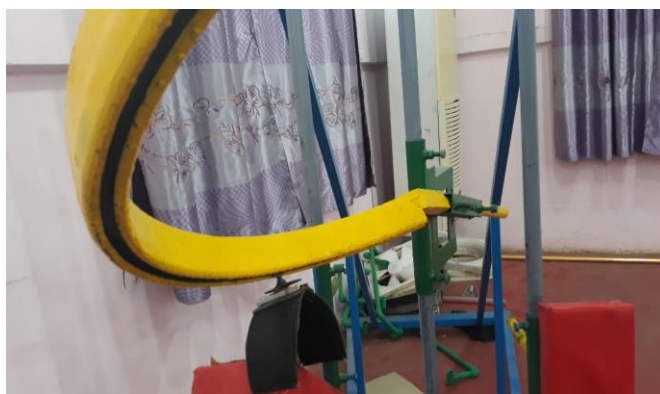
شكل (8) يوضح قاعدة المسار الحركي

7- عمود المسار الحركي للضربة الأمامية: هي عبارة عن اسطوانة حديدية مستطيلة مقوسة و مجوفة من الاسفل ومفتوح عند مشاهدة مقطعها العرضي وعلى شكل قوس عند مشاهدتها من المقطع الطولي ، أي ان هذا المسار يشبه سكة الحديد حيث يسير بهذه السكة الحديدية عتلة تحتوي على اربعة عتلات ومربوطة بحزام مطاطي يمسك بيد اللاعب اثناء اداء اللاعب للضربة الامامية ، حيث ان هذا المسار له القدرة على الدوران لجميع الاتجاهات بهدف ضبط المسار الحركي حسب طول اللاعب ، حيث ان سمك الحديد الاسطوانة (2) ملم ويبلغ سمك المسار الحركي (8) سم وبعرض (4) سم ، ويبلغ طول المسار الحركي (100) سم وتبلغ الاسطوانة الدائرية التي تربط المسار الحركي مع قاعدة المسار الحركي (50) سم ومن خلال هذه الاسطوانة الدائرية نستطيع تطويل وتقصير المسار الحركي وحسب الابعاد المطلوبة للأداء ، وكما موضح