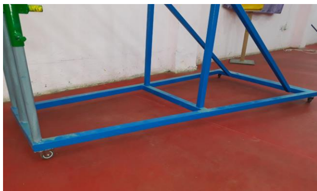
شكل (3) يوضح القاعدة الحديدية

الجهاز الى احد الجانبين ، والهدف من صغر القاعدة الامامية عن الخلفية، لتسهيل حركة الرجلين والتأكد من مبدأ السلامة للاعب ، ويبلغ عرض المقطع الحديدي (8) سم وسمكه (4) سم ، وكما موضح بالشكل التالي: