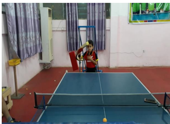
شكل (9) يوضح آلية عمل الجهاز المصمم

2-4-5 آلية عمل الجهاز المصمم: بعد أن تم توضيح اجزاء الجهاز نستطيع توضيح عمل الجهاز بصورة مبسطة وذلك من خلال وقوف اللاعب امام الجهاز بحيث تكون يد اللاعب تحت عمود المسار الحركي حتى يسهل ربط يد اللاعب بالحزام المطاطي ،حيث نستطيع الاستفادة من عمل الجهاز مرة من خلال المرجحة باليد الحاملة بالمضرب والجذع ايضا واداء تكرارات بزمان معين وبدون كرة ، ومرة اخرى من خلال اداء تكرارات بمساعدة جهاز قاذف الكرات والمرجحة بيد للاعب والجذع وكما مبين بالشكل التالي: