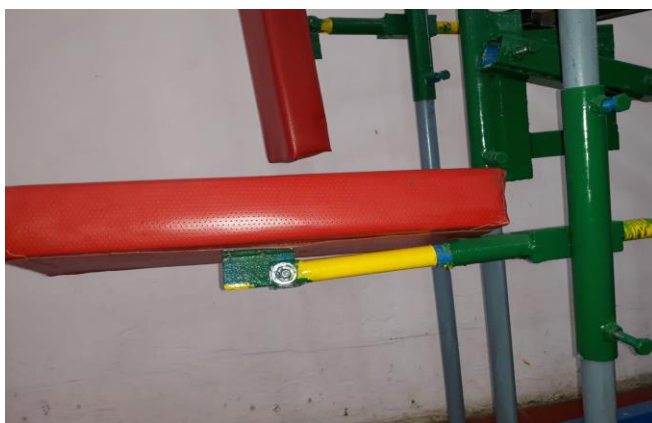
شكل (7) يوضح المصد السفلي

6- قاعدة المصد السفلية: يحتوي هذا المصد على نفس اجزاء المصد الخلفي ولكن يكون عمل هذا المصد بعد ضبط اللاعب للمسار الحركي بعد فترة تدريبية منتظمة حيث يعمل هذا المصد على تحديد اللاعب من نزول اليد الحاملة للمضرب لغرض الاقتصاد بالجهد وتقليل الفترة الزمنية للأداء ويكون شكل هذا المصد نفس شكل المصد الخلفي لكن من اسفل اليد وليس من خلفها كما في المصد الخلفي وكما موضح بالشكل التالي: