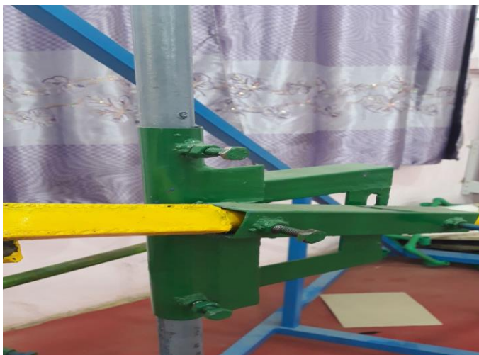
شكل (6) يوضح قاعدة المسار الحركي

5- قاعدة المسار الحركي: هي عبارة عن قاعدة مستطيلة توجد في داخل الاسطوانة الوسطية من الجهاز ، حيث تكون هذه القاعدة لها القدرة على تغيير الاتجاهات بجميع الجهات وتحتوي القاعدة على عمود المسار الحركي الذي بدوره يقوم بتحديد المسار الحركي للضربة الامامية للاعب ، حيث يمكن لهذه القاعدة تغيير زاوية المسار الحركي للأعلى أو للأسفل أو للجانب وكذلك لها القدرة على الدوران (360) والغرض من ذلك لتسهيل ضبط المسار الحركي المطلوب حسب طول اللاعب، وكما موضح بالشكل التالي: