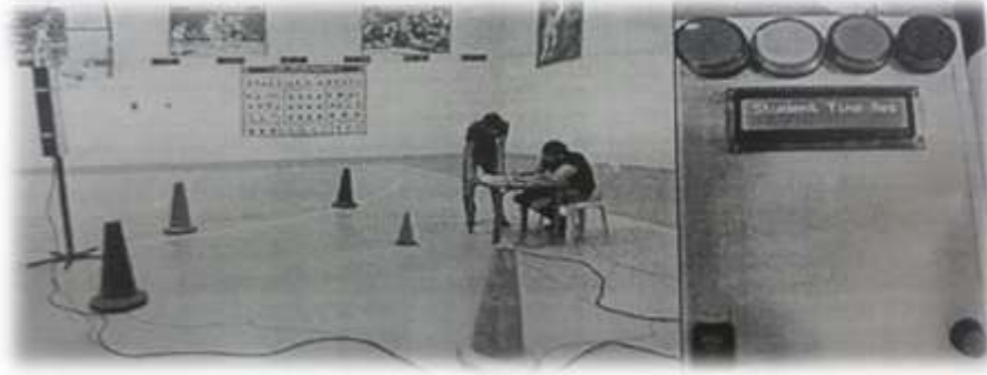
شكل (1) يوضح جهاز سرعة الاستجابة الحركية

2-4-2 اختبار مهارة استقبال الارسال: (علي مصطفى طه ، 1999 ، ص 185)