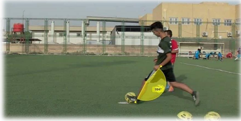
شكل (8) يُبين زاوية الركبة للرجل الارتكاز لحظة الارتكاز

4- زاوية الركبة للرجل الارتكاز لحظة الارتكاز: هي الزاوية المحصورة بين الخط الواصل من نقطة مفصل الكاحل الى منطقة الركبة ومن نقطة مفصل الورك الى الركبة وكما مبين في الشكل (8)