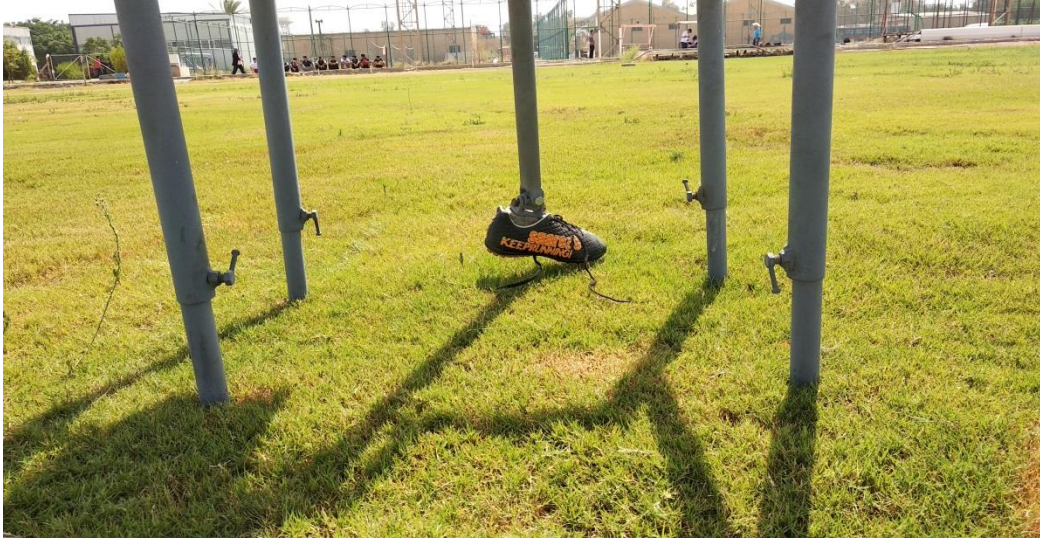
شكل (3) يبين الأرجل المعدنية الخاصة بالجهاز

الغاية من تصميم الجهاز : التعرف على المتغيرات البايوميكانيكية الصحيحة لتنفيذ الركلات الثابتة بشكل علمي ومباشر وامام العينة ليتم تنفيذ الضربات وفق الاسس البايوميكانيكية , كما تم تنفيذ الجهاز وتعريف العينة بأهمية الزوايا للقدم وتوجيه الكرة والتأثير عليها ودقة تنفيذها مما يعطي الدافعية والتشويق والاثارة للتدريب , وازضافة الى ذلك ان الجهاز يحتوي على ثبات في الاداء (ضبط للمتغيرات البايوميكانيكية ) بخلاف اللاعبين .