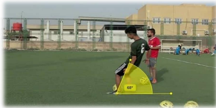
الشكل (7) يُبين زاوية ميل الجسم لحظة ضرب الكرة

3- زاوية ميل الجسم لحظة ضرب الكرة: هي الزاوية المحصورة بين المستوى الافقي ومستوى الجسم لحظة ضرب الكرة وكما في الشكل (7).