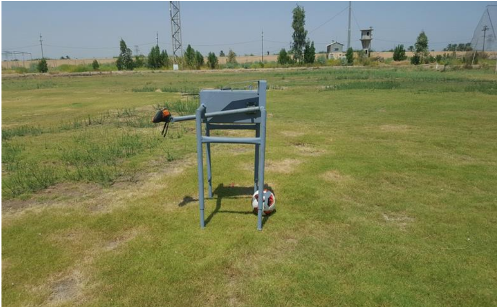
شكل (4) يبين شكل الجهاز كاملاً