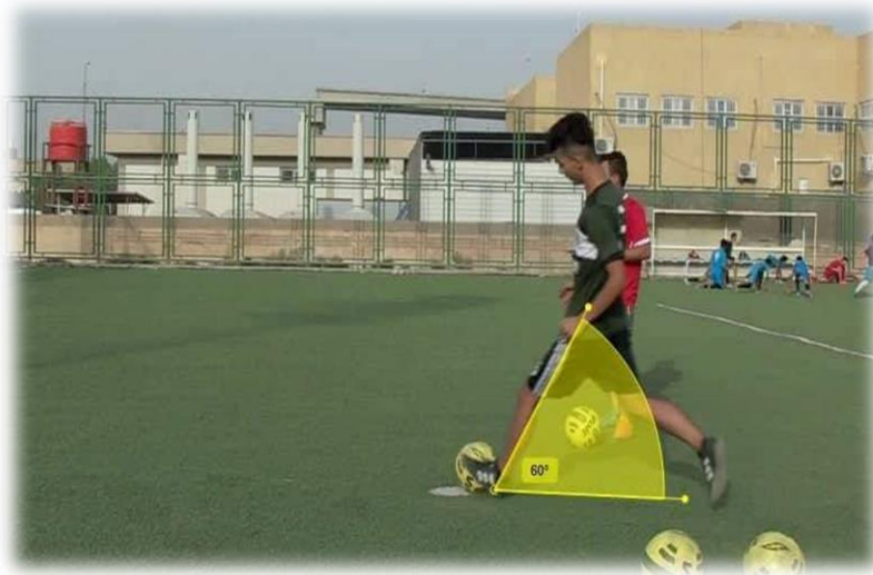
الشكل (6) يُبين زاوية ميل الجسم لحظة الارتكاز

3- زاوية ميل الجسم لحظة ضرب الكرة: هي الزاوية المحصورة بين المستوى الافقي ومستوى الجسم لحظة ضرب الكرة وكما في الشكل (7).