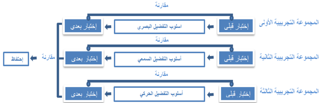
الشكل (1) يوضح التصميم التجريبي للبحث

إعتمد الباحثان التصميم التجريبي المعروف باسم " تصميم المجموعات المتكافئة عشوائية الاختيار ذات الاختبارين القبلي والبعدي " (علاوي وراتب، 1999:232)، الموضحة بالشكل (1) في أدناه: