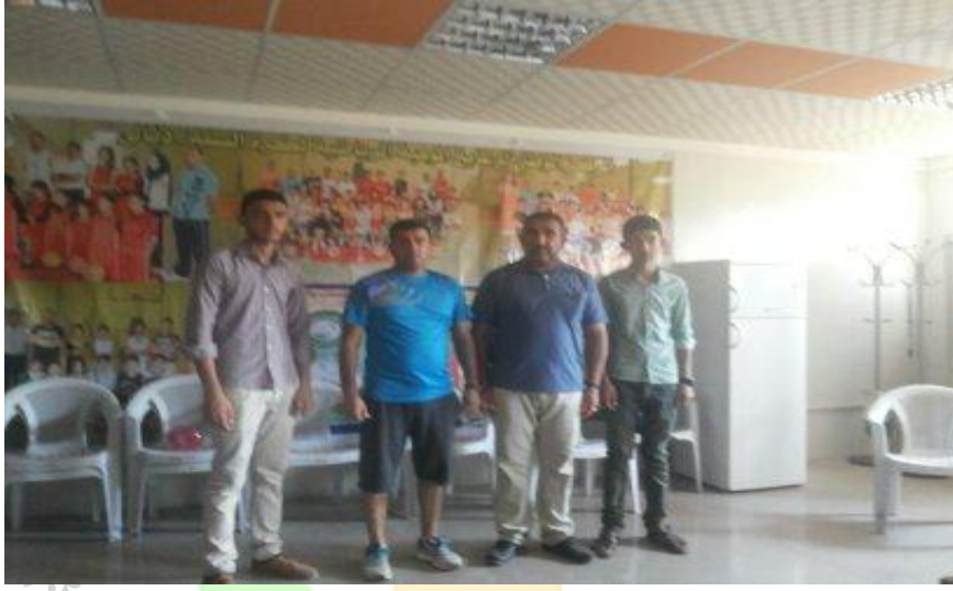
فريق العمل المساعد