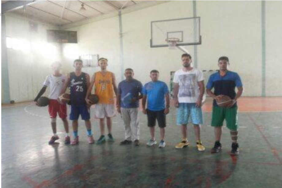
قسم من العينة