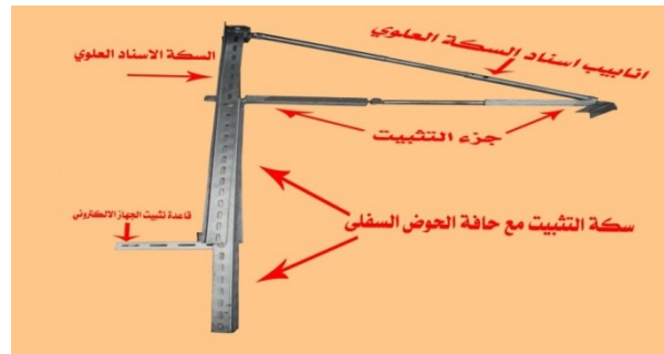
شكل ( ١ )

جاءت فكرة استخدام الجهاز من خلال ملاحظة الباحث للجهاز الالكتروني وعلى طريقة قياسه حيث يستخدم لقياس أي قوة شد أو كتلة تسلط على طرفيه العلوي والسفلي فيقوم بقراءتها بوحدات الكيلوغرام وأجزائه بدقة على شاشة رقمية الكترونية، وان ما يميز عمل الجهاز هو قدرته على قراءة أي تغير يحصل في كمية الشد المسلطة عليه سواء كانت عالية أو منخفضة وإظهارها أنيا بدقة، وان هذه اختلافات الشد في إظهار القوة هو ما يحصل في اغلب أنواع الرياضة وفي رياضة السباحة خصوصاً، وبما إن معظم أجهزة قياس القوة في المجال الرياضي تقيس مقدار القوة بالكيلوغرام لكنها خارج الماء، هذا مما دفع الباحث إلى استخدام عمل الجهاز وتوظيفه عن طريق تصميم أجزاء متعددة ليتم تثبيته واتصاله بشكل مبتكر مع جسم السباح داخل الماء بصورة تمكنه من أداء حركات السباحة بشكل طبيعي لقياس مقدار القوة الدافعة الفعلية التي ينتجها السباح من حركته داخل الماء.