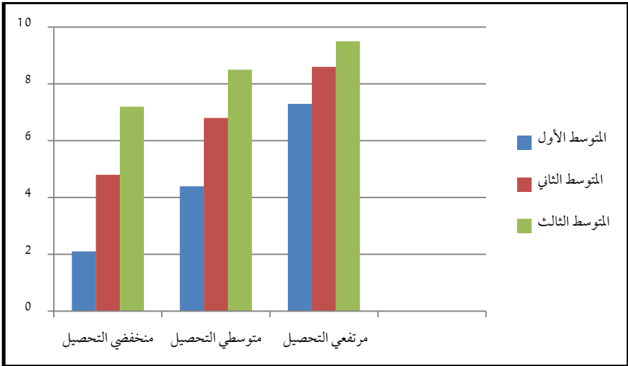
شكل (2) المقارنة بين متوسطات درجات الطلاب وفقا لمستوياتهم في المدرسة الثانية

إجمالاً تتفق نتيجة الدراسة الحالية مع نتيجة دراسة كل من بيريس (Pierce, 2013)؛ وزنقن