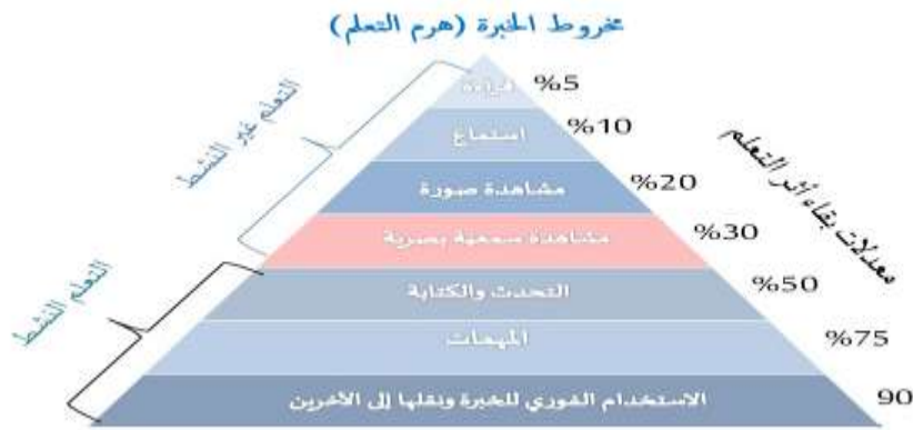
شكل (١) هرم التعلم

تعتبر طريقة التعليم بالمشروعات شكل من أشكال إستراتيجية التعلم بالعمل، وكمثال لهذه الطريقة هي قيام الطلاب بأنشاء سوق في المدرسة ويقوم كل طالب بالبيع والشراء لمنتجاتهم التي زرعوها وأنتجوها سابقاً.