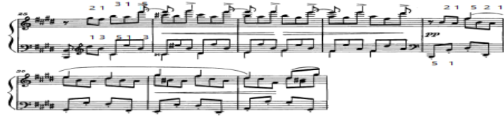
شكل (٤) يوضح من م(٢٥): م(٣٢)