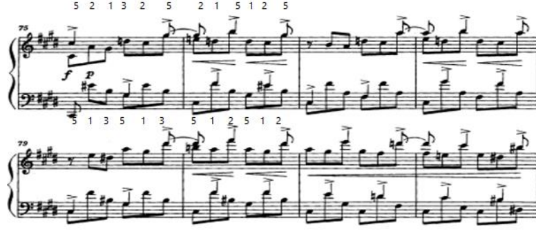
شكل (٩) يوضح الجملة الموسيقية من م(٧٥): م(٨٢)

من م(٨٣) ٢ : م(٨٦) هي عبارة موسيقية تعزف فيها اليدين معاً نفس النموذج اللحني والإيقاعي في شكل نغمات ميلودية متسلسلة تسلسل هابط، وم(٨٥،٨٦) تصوير للمازورتين (٨٣،٨٤) علي بعد أوكتاف هابط كما هو موضح بالشكل التالي: