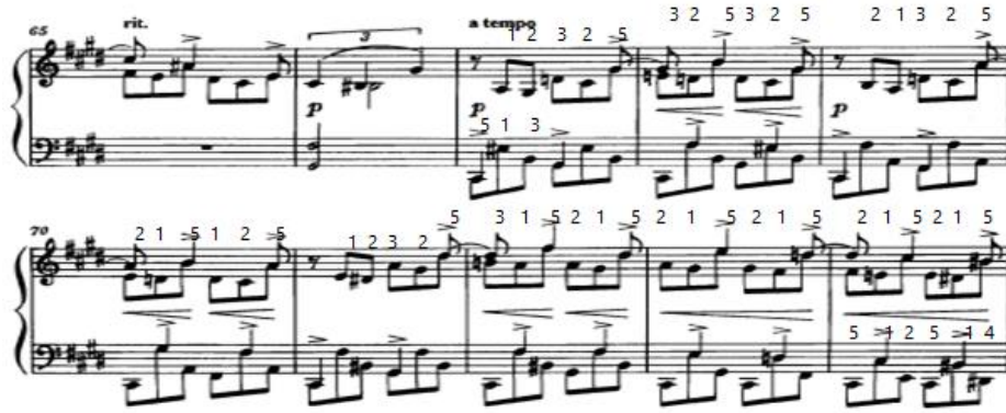
شکل (٨) یوضح الجملة الموسیقیة من م(٦٧): م(٧٤)

من م(٦٧) : م(٧٥) هی جملة موسیقیة عبارة عن تکرار لنفس النموذج اللحنی للمقطوعة بعزف مازورتین ثم تصویرهم علی أبعاد مختلفة وتثبيت بعض النغمات بالرباط الزمني، مع كثرة التغبیر فی علامات الرفع والخفض وذلك للثناء اللحنی ثم العودة للقفلة علی سلم دو/الصغیر فی شکل نغمات مزدوجة علی مسافة أوکتاف كما هو موضح بالشکل التالی: