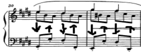
شكل (٦) يوضح كيفية أداء إيقاع ♩ مقابل إيقاع ♩