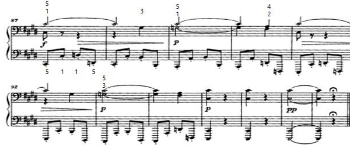
شكل (١١) يوضح الكودا من م (٨٧): م (٩٨)

كودا (Coda): من م (٨٧) : م (٩٨) هي عبارة عن تطويل للقفلة في شكل نغمات مزدوجة تعزفها اليد اليمني باستخدام الرباط الزمني علي إيقاع البلاش والنوار في صوت السبرانو، وتصاحبها في اليد اليسرى أوكتافات ميلودية علي إيقاع \text{♩} وبالأداء المتقطع " إستكاتو"، وأنهى المؤلفه بأوكتافات هارمونية تؤديها اليدين معاً في السلم الأساسي للمقطوعة مستخدماً علامة الكورونا \text{☉} وهي رمز للتدوين الموسيقي يشير إلى أنه يجب إطالة النوتة الموسيقية إلى مابعد النوتة العادية التي تشير إليها قيمة النوتة الموسيقية. كما هو موضح بالشكل التالي: