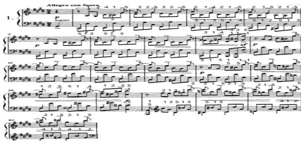
شكل (١) يوضح من أناكروز م (١): م (٢٠)

من أنا كروز م (١: ٢٠) هي عبارة نموذج لحنى واحد مع تكراره وتصويره عدة مرات مستخدماً المؤلف إيقاع لَبَّ باليد اليمنى واليسرى معاً مع عزف ثلاث أصوات وتثبيت صوت الباص في اليد اليسرى بإيقاع النوار وعزف باقي النغمات وتثبيت صوت السوبرانو في اليد اليمنى (سينكوب) بإيقاع النوار مع الضغط عليه بقوة لوجود مصطلح (>) مع ملاحظة أن من م (٥: ٨) هي تكرار للموازير من م (١: ٤) ، ومن م (٩ : ١٢) هي عبارة موسيقية عبارة عن تصوير لمسافة أوكتاف صاعد للموازير (١: ٤) مع لمس درجة الحساس سي # ، ومن م (١٣ : ١٦) هي تكرار للموازير من (٩: ١٢) مع التكثيف النغمى بتغيير علامات الرفع والخفض وذلك للشراء اللحنى ثم العودة للقفلة علي سلم دو/الصغير في شكل نغمات مزدوجة علي مسافة أوكتاف، ومن م (١٧ : ٢٠) هي عبارة عن تصوير للموازير (٩: ١٢) في سلم سي/الصغير كما هو موضح بالشكل التالي: