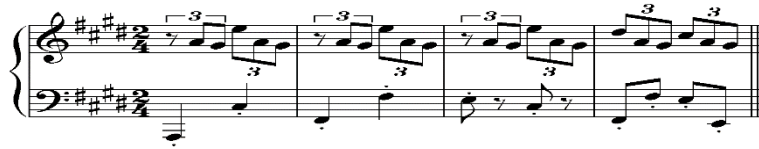
شكل (٥) تمرين تمرين مقترح لتسهيل الأداء المتصل مع المتقطع