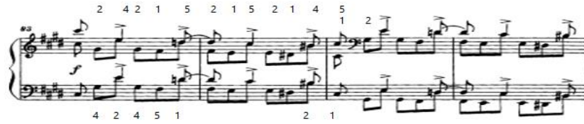
شكل (١٠) يوضح الجملة الموسيقية من م(٨٣): م(٨٦)

من م(٨٣) ٢ : م(٨٦) هي عبارة موسيقية تعزف فيها اليدين معاً نفس النموذج اللحني والإيقاعي في شكل نغمات ميلودية متسلسلة تسلسل هابط، وم(٨٥،٨٦) تصوير للمازورتين (٨٣،٨٤) علي بعد أوكتاف هابط كما هو موضح بالشكل التالي: