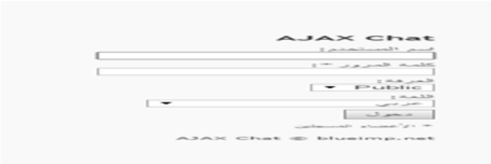
شكل (٤) واجهة الدخول للشات.

بينما يوضح الشكل (٣) واجهة الدخول للشات الذي يقوم الطلاب من خلاله بالتواصل مع المعلم وطرح كافة اسئلتهم عليه.