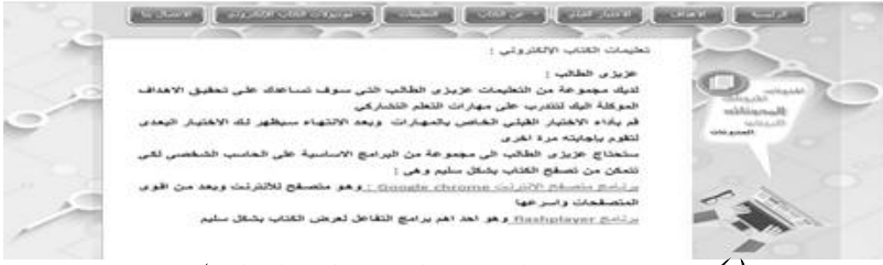
شكل (٢) الصفحة الرئيسية للموقع التعليمي الخاص بالكتاب الإلكتروني