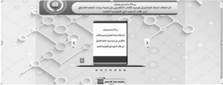
شكل (٣) فبذة عن الكتاب الإلكتروني

بينما يوضح الشكل (٣) واجهة الدخول للشات الذي يقوم الطلاب من خلاله بالتواصل مع المعلم وطرح كافة اسئلتهم عليه.