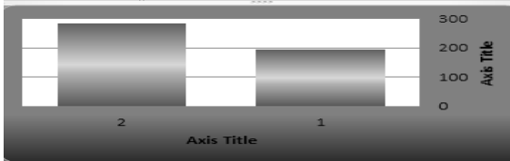
شكل (٢) يوضح متوسط درجات طلاب المجموعة التجريبية في التطبيقين القبلي والبعدي لبطاقة الملاحظة.

وفيما يلي رسم بياني يوضح ارتفاع متوسط درجات الطلاب في التطبيق البعدي مقارنة بمتوسط درجاتهم في التطبيق القبلي لبطاقة الملاحظة: