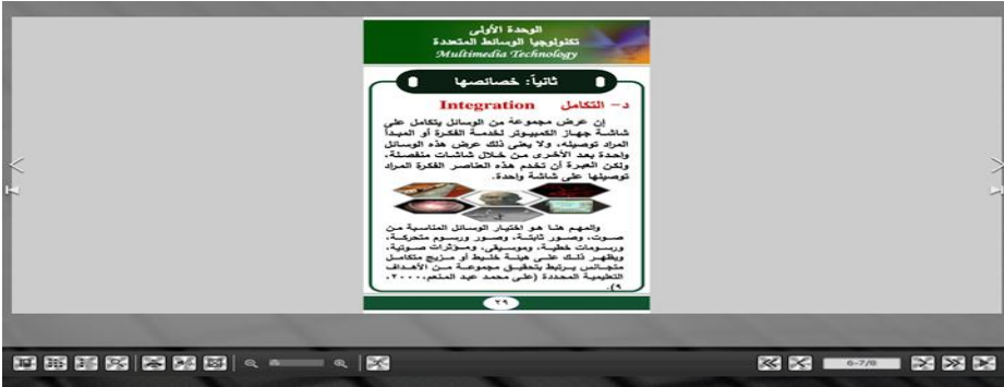
شكل (٤) نموذج لنمط العرض العمودي للصفحات