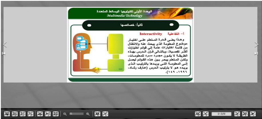
شكل (٦) نموذج نمط التصميم الساكن