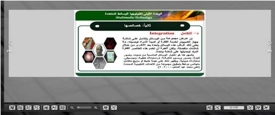
شكل (٣) نموذج لنمط العرض الأفقي للصفحات

◀ إنتاج مادة المعالجة التجريبية (الكتاب الإلكتروني بأشكاله الثماني)، وقد استخدم في ذلك بعض أدوات التأليف المتخصصة، وتمثلت في أداة Kvisoft FlipBook Maker؛ إضافة إلى أداة Adobe indesign cs5، للقيام بعمل برمجة للكتاب الإلكتروني، وتوضيح الأشكال التالية بعض واجهات التفاعل الخاصة بالكتاب الإلكتروني وفقا لمستويي كل متغير من المتغيرات الثلاث للبحث كل على حده: