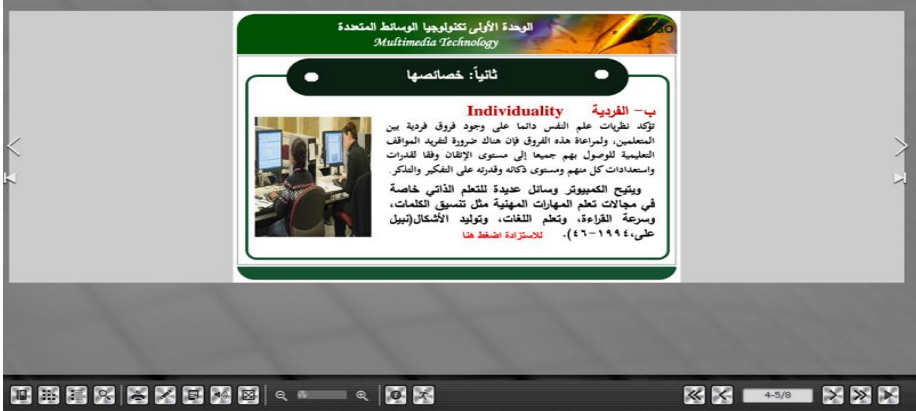
شكل (٧) نموذج نمط التدعيم (المزود بنقاط وصول مباشر للمصادر الخاصة بالكتاب ومحركات البحث عبر الويب)