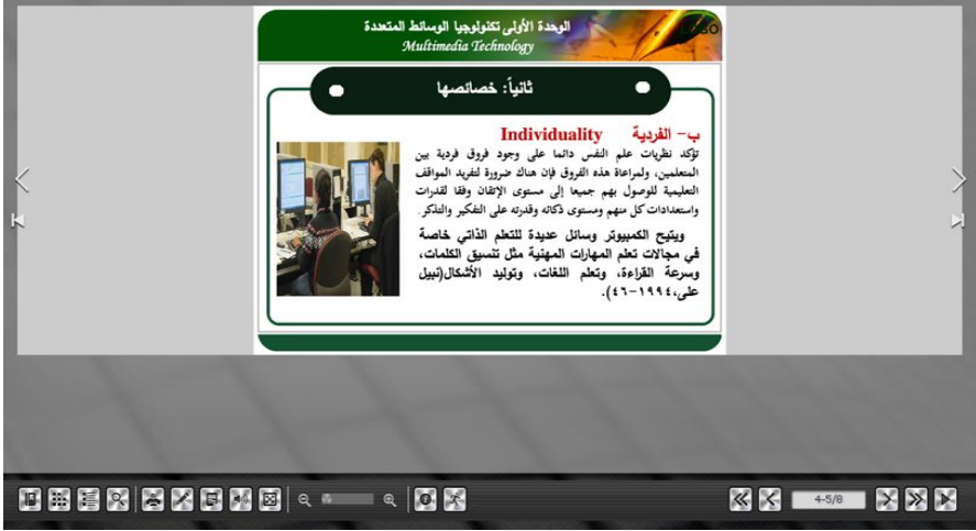
شكل (٨) نموذج نمط التدعيم (غير المزود بنقاط وصول مباشر للمصادر الخاصة بالكتاب ومحركات البحث عبر الويب)