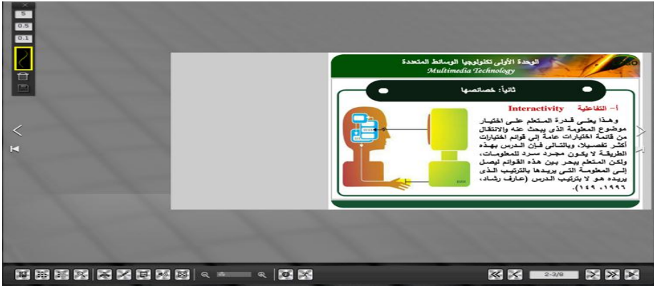
شكل (٥) نموذج نمط التصميم المرئي