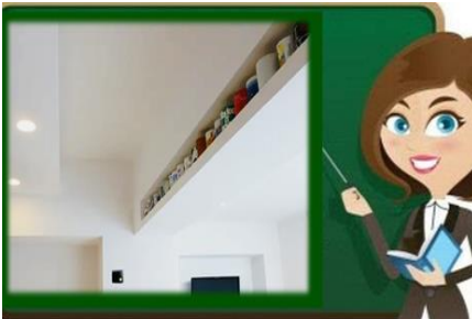
١٢- إستغلال تجاويف السقف (المنافذ من أعلى)