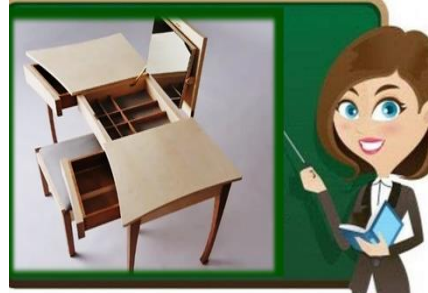
٨- الأثاث الوظيفي أو متعدد الأغراض