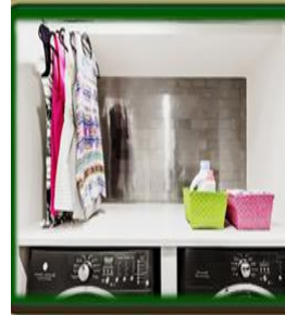
٦- تنظيم مكان الغسيل • إضافة لثعابت للغسيل التنظيف • سلال بلاستيكية لحفظ سائل التنظيف والماسحوق