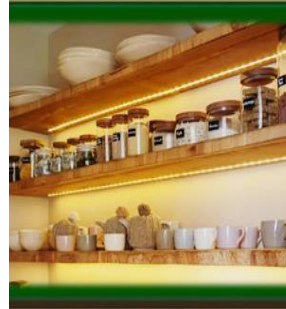
٤- إستخدام العلب بدلاً من الأكياس