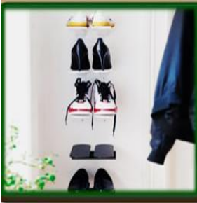
٧- أرفف صغيرة بجوار الباب لحفظ الأحذية