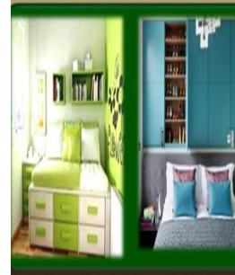
١٦- عمل ارفف تخزين فوق السرير