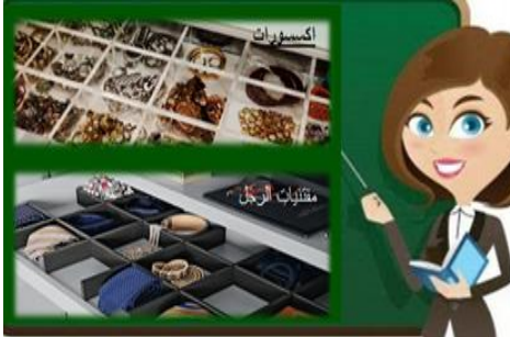
١١- مقسم الأدرج