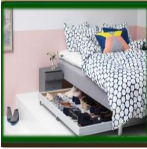
١٥- استخدام أسفل السرير لتخزين الأحذية