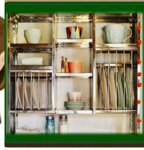
٢- إستخدام حامل معدني لتنظيم الأدوات في المطابخ الصغيرة