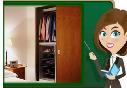
١٠- إضافة قطعة خاصة لتنظيم الأغراض في الدواليب