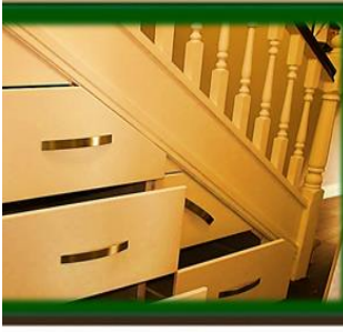
٢- إستغلال السلم إن وجد