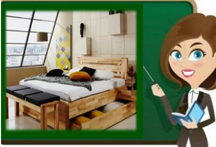
٩- أدرج أسفل السرير