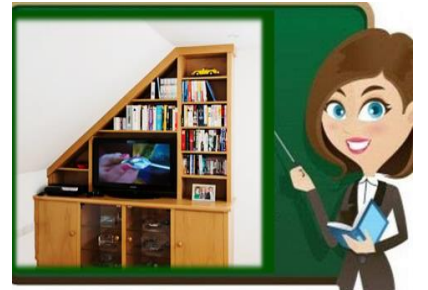
١٢- الإستفادة من الزوايا