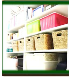
١٤- الصناديق والسلال