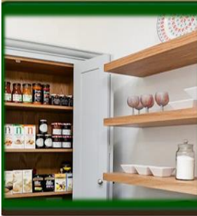
٥- الرفوف تخلق مساحة إضافية للتخزين