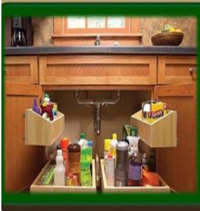
١٧- استخدام أسفل الحوض في التخزين