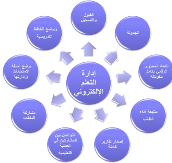
شكل (١) مكونات نظام إدارة التعلم الإلكتروني