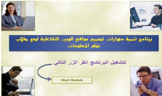
شكل (٣) أزرار الابحار في البرنامج

وقد راعى الباحثان فيها عنصر الجذب والتشويق لإثارة دافعية المتعلم من خلال الألوان الجذابة وبعض الصور.