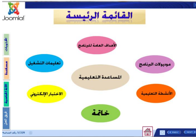
شكل (٦) قائمة الإبحار الرئيسة

تميز الروابط التي تنقل الطالب الى الإنترنت داخل البرنامج باللون الأزرق ويوجد خط أسفل الرابط.