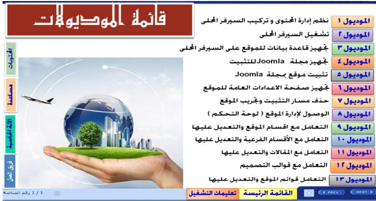
شكل (٤) أزرار الابحار فى البرنامج