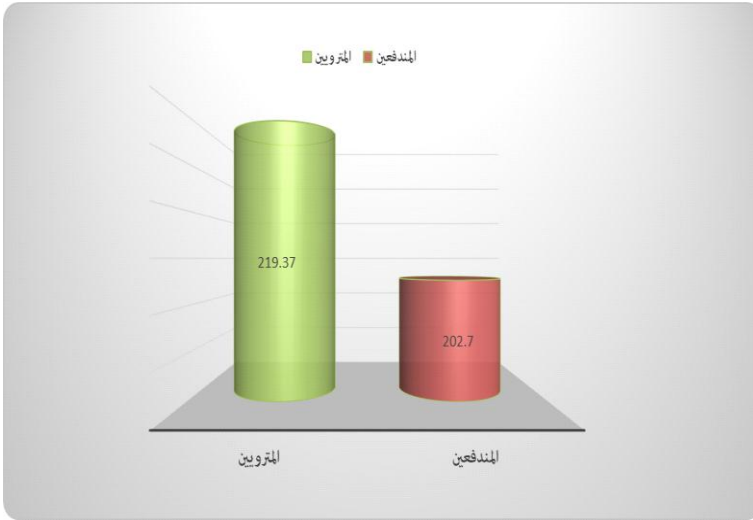
شكل (5) متوسطات درجات طلاب تكنولوجيا التعليم في التطبيق البعدي لاختبار الجانب الأدائي لمهارات صيانة الحاسب الآلي ترجع الى الأثر الأساسي لاختلاف الأسلوب المعرفي (مترويين /مندفعين)

ومن النتائج السابقة يتم قبول الفرض الإحصائي الخامس الذي ينص على أنه " توجد فروق ذات دلالة إحصائية عند مستوى (0.05) بين متوسطات درجات طلاب تكنولوجيا التعليم في التطبيق البعدي لاختبار الجانب الأدائي لمهارات صيانة الحاسب الآلي ترجع الى الأثر الأساسي لاختلاف الأسلوب المعرفي (مترويين /مندفعين) لصالح الأسلوب المعرفي المترويين."