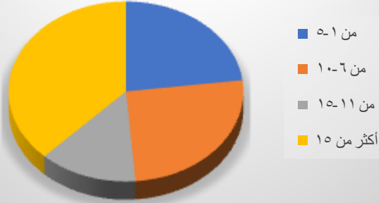
جدول رقم (٣)