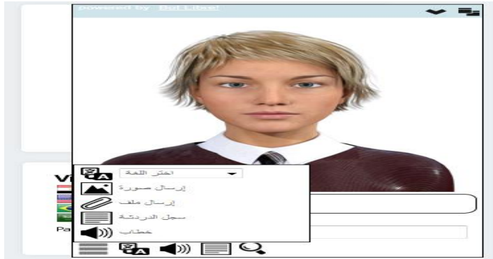
شكل (٢) أدوات المساعد الذكي بيئة التعلم الشخصية