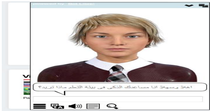
شكل (٣) محرك البحث بالمساعد الذكي بيئة التعلم الشخصية

تم تحديد مواد المساعدة المرتبطة بوحدة (الإنترنت وتطبيقاته التعليمية ) ، حيث تم صياغه محتويات المساعدة وعرضها في شكل ردود علي استفسارات الطلاب وأيضا وسائط متعددة بحيث تناسب كل طالب حسب مستواه المعرفي .