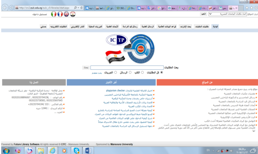
شكل ( 3 ) شبكة اتحاد مكتبات الجامعات المصرية.

أولاً : نموذج للمؤسسات (شبكة اتحاد مكتبات الجامعات المصرية) (١٠٥)