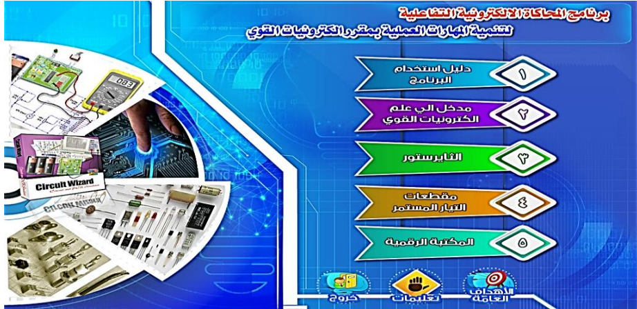
شكل ( ٢ )

٦. تصميم واجهات التفاعل ببرنامج المعالجة التجريبية، شكل (٢) يوضح نموذج لواجهة التفاعل.