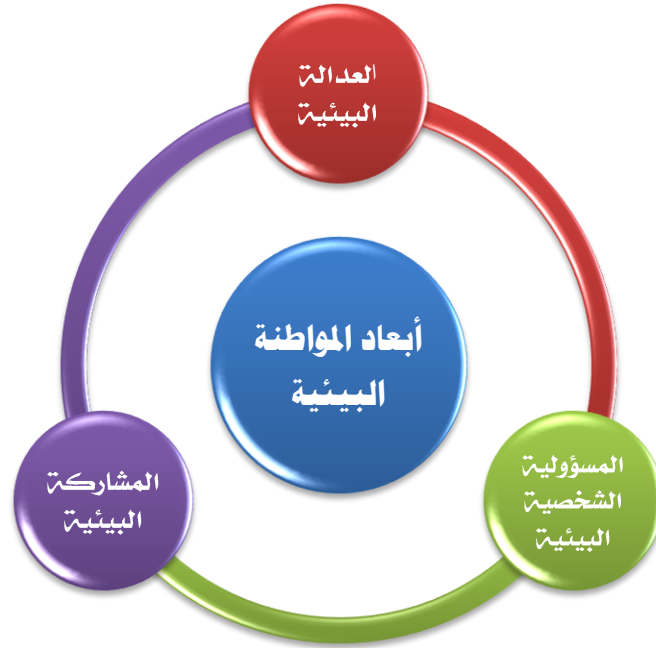
شكل رقم (٢) أبعاد المواطنة البيئية