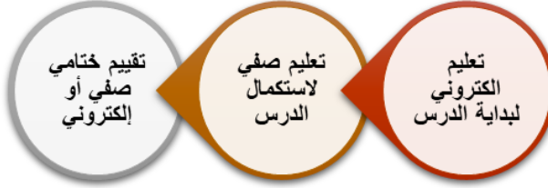
شكل (٣) النمط الثالث للتعليم المدمج (زيتون، ٢٠٠٥، ١٧٥)

النمط الثالث: يتم فيه تعلم الدرس من خلال أساليب التعليم الإلكتروني أولاً ثم من خلال أساليب التعليم الصفي حيث يتم الدمج بين الأسلوبين لشرح الدرس