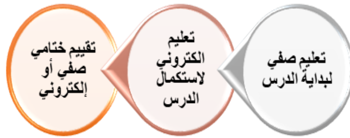
شكل (١) النمط الأول للتعليم المدمج (زيتون، ٢٠٠٥، ١٧٥)

قامت دراسة كل من برنتك وآخرون (Bernatek, etal., 2012, pp5-13)، ودراسة والنبي (Walne, 2012, p3)، وكذلك دراسة هورن وستاكر (Horn & Staker, 2011, )