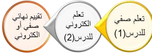
شكل (٢) النمط الثاني للتعليم المدمج (حسن زيتون، ٢٠٠٥، ١٧٦)

الواحد، ويتم التقويم بأساليب التقييم التقليدية أو الإلكترونية وهذا النمط ينطبق على الفصل المعكوس (المتغير المستقل لورقة العمل الحالية).