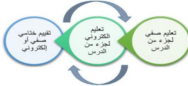
شكل (٤) النمط الرابع للتعليم المدمج (زيتون، ٢٠٠٥، ١٧٧)

النمط الرابع: وهو يشبه كلا من النمطين الثاني والثالث، إلا أن التناوب بين التعليم التقليدي