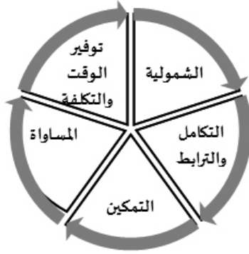
شكل (1) أهداف نظام نور