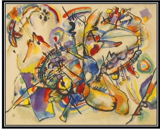
"الساحة الحمراء" فاسيلي كاندينسكي ١٩١٦م زيت على القماش، موسكو، ١٣٠ x ١٣٠ سم شكل رقم (٣)