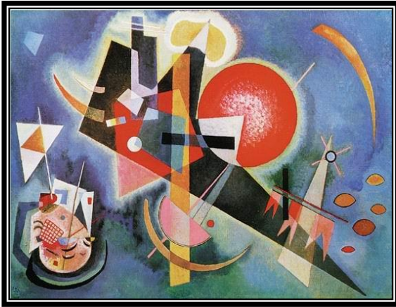
"نيل بلو" فاسيلي كاندينسكي ١٩٢٠م زيت على القماش، نيويورك، ٧٠٠ x ٤٤٠ سم شكل رقم (٤)