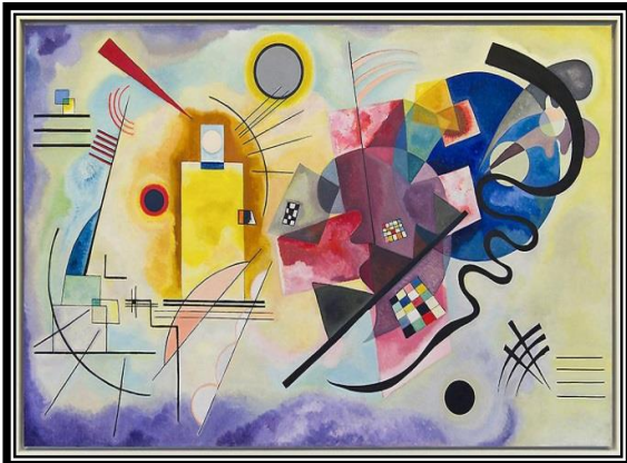
"الأصفر والأحمر والأزرق" فاسيلي كاندينسكي ١٩٢٥م زيت على القماش، فرنسا، ١٢٧ x ٢٠٠ سم شكل رقم (٦)