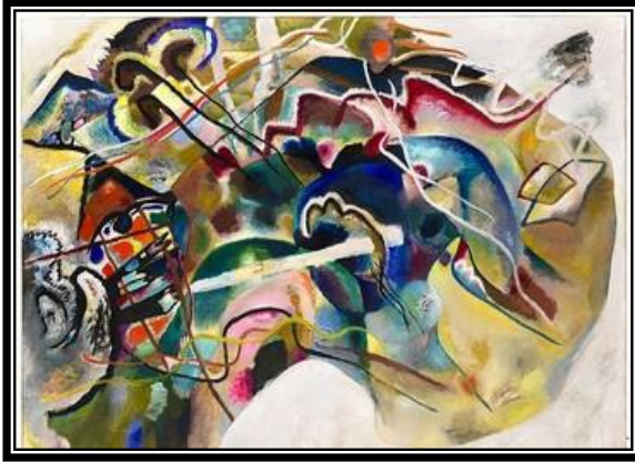
"ذات الحدود البيضاء" فاسيلي كاندينسكي ١٩١٣م زيت على القماش، نيويورك، ١٤٠ x ٢٠٠ سم شكل رقم (٢)