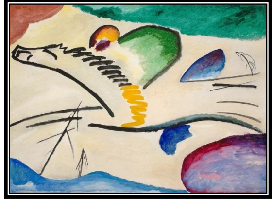
"الحصان والفارس" فاسيلي كاندينسكي ١٩١١م زيت على القماش، نيويورك، ٩٤ x ١٣٠ سم شكل رقم (١)