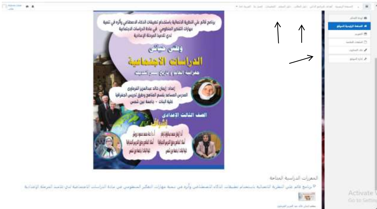
شكل (1) العناصر الأساسية بالشاشة الرئيسية للبرنامج الذكي