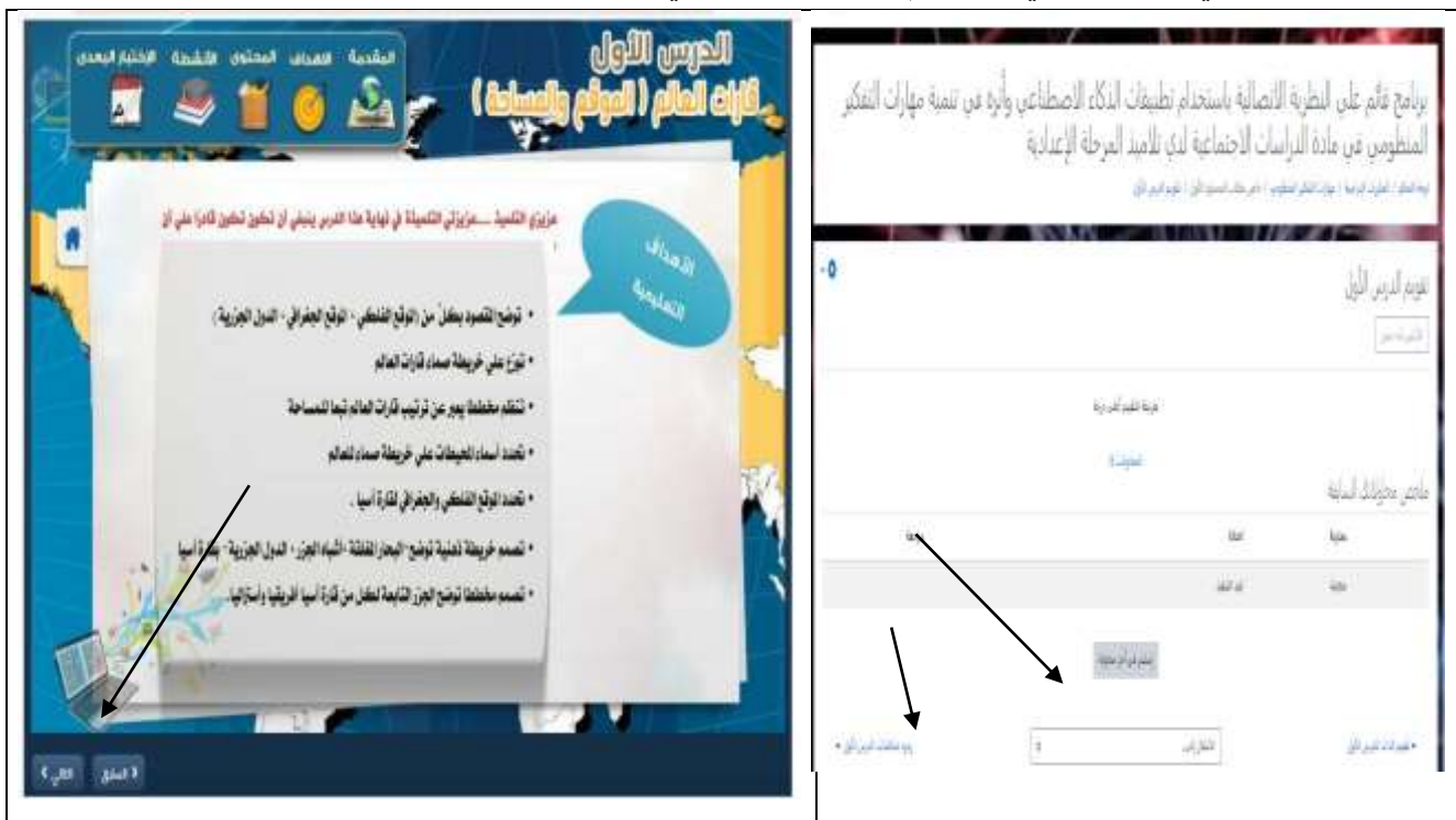
شكل (2) شاشات توضح روابط الانتقال بين شاشات البرنامج