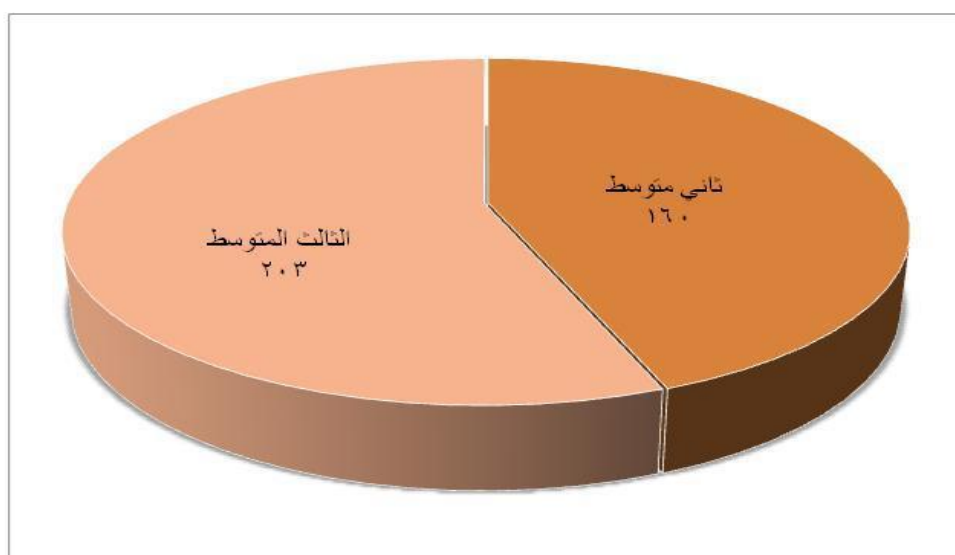
شكل رقم (٢) توزيع أفراد عينة الدراسة وفقاً لمتغير الصف

يتضح من خلال الجدول رقم (٢) أن ما يزيد على نصف أفراد عينة الدراسة (٢٠٣) طالباً يمثلون ما نسبته (٥٥,٩%) بالصف الثالث المتوسط، في حين أن هناك (١٦٠) طالباً يمثلون ما نسبته (٤٤,١%) بالصف الثاني المتوسط.