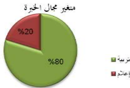
شكل (٣) توزيع أفراد العينة حسب متغير الخبرة

يوضح الجدول (٣) والشكل (٣)، توزيع أفراد العينة حسب متغير مجال الخبرة حيث خلصت النتائج إلى أن ما نسبته (٧٩,٧%) من أفراد عينة الدراسة مؤهلين ضمن مجال التربية، في حين أن ما نسبته (٢٠,٣%) من أفراد العينة ينتمون إلى مجال الإعلام، وتعتبر النسبة غير متكافئة من منطلق مجال الخبرة، وهذا قد يرجع إلى طبيعة شروط التوظيف في مهنة التعليم التي تشترط تطابق المستوى مع التخصص، غير أننا لا نستبعد توافق كلا المجالين في تعليم بعض المساقات المشتركة على مستوى الكليات غالباً دون المدارس.