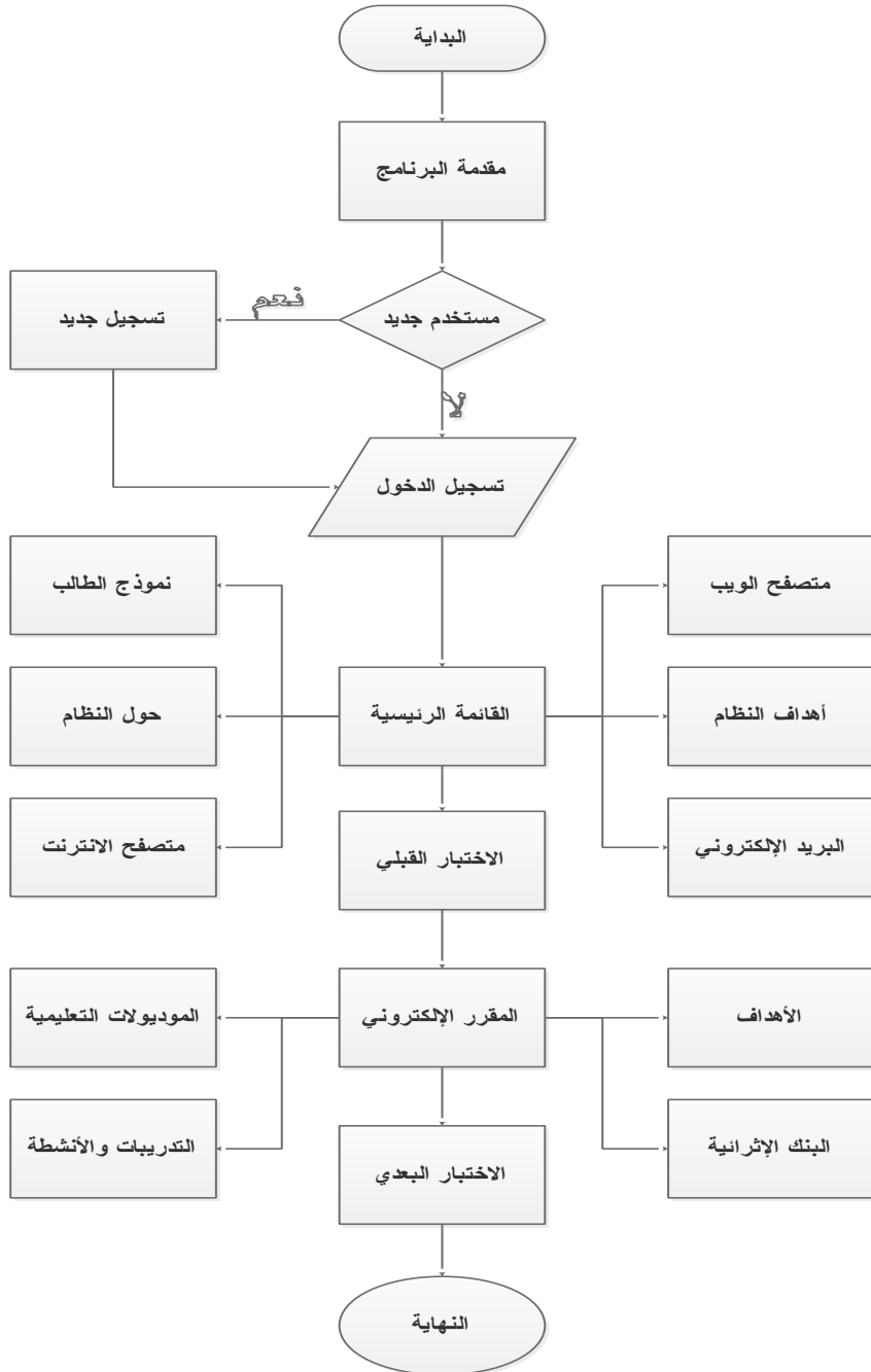
شكل (٢) خريطة سير العمل في النظام الإلكتروني الذكي المقترح