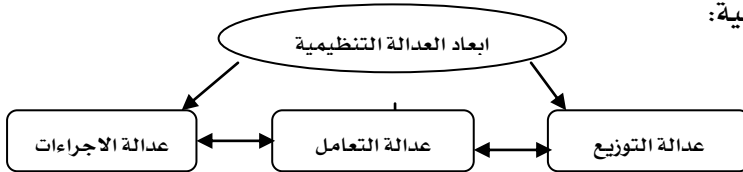
شكل رقم (١): أبعاد العدالة التنظيمية

تشير معظم الأدبيات التي تتناول موضوع العدالة التنظيمية إلى وجود ثلاثة أبعاد رئيسية وهي (عدالة التوزيع ، عدالة الإجراءات، عدالة التعاملات) (Rego&Cunha,2006:79) إلا أن هناك دراسات أخرى ترى أن مفهوم العدالة التنظيمية هو مفهوم ثنائي البعد أي يتضمن عدالة التوزيع وعدالة الإجراءات فقط كما في دراسة (Moormans,1991) ودراسة (Greenberg,1990)، كما أن هناك بعض الدراسات مثل دراسة (الحميدي،٢٠١٢) ودراسة (القطاونة،٢٠٠٣) أضافت بعدا رابعا وهو العدالة التقويمية . وترى الدراسة أن طبيعة مفهوم العدالة التنظيمية يتطلب التعامل معه على أنه مفهوم ثلاثي الأبعاد (التوزيع والتعامل والإجراءات). وفيما يلي توضيح لأبعاد العدالة التنظيمية: