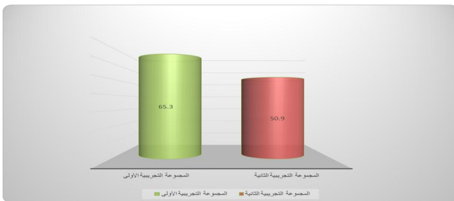
شكل (٢) متوسطي طلاب المجموعتين التجريبتين في التطبيق البعدي لبطاقة الملاحظة المرتبطة بمهارات البرمجة

ويتضح من الجدول (٢) أن مستوى الدلالة مساوياً (٠.٠٠٠٠)، وهذا يدل على وجود فروق دالة إحصائية بين متوسطي طلاب المجموعتين التجريبتين في التطبيق البعدي لبطاقة الملاحظة المرتبطة بمهارات البرمجة عند مستوي الدلالة (\alpha \leq 0.05) ، وحيث أن متوسط درجات طلاب المجموعة التجريبية الأولى