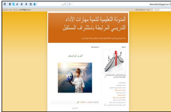
شكل رقم (١): الواجهة الرئيسية للتفاعلية للمدونة الالكترونية المقترحة

تم تحكيم المدونة التعليمية للتحقق من إمكانية استخدامها لتحقيق الأهداف التي انشئت من أجلها ، وتم عرضها على محكمين في مجال تقنيات التعليم ، وذلك بهدف التحسين والتطوير، والاستفادة من توجيهاتهم، وكانت توجيهات السادة المحكمين ترتبط بلون وحجم الخط حتى يتناسب مع لون الخلفية ويكون مريحا للعين . وتم إجراء التعديلات التي اقراها السادة المحكمون. ويوضح شكل رقم (٤،٣،٢،١) المدونة في شكلها النهائي .