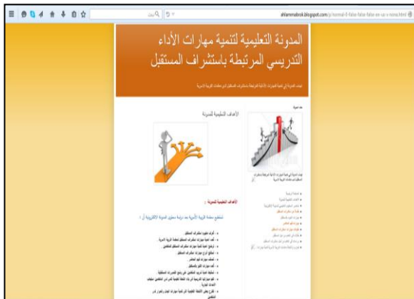
شكل رقم (٢): واجهة الأهداف التعليمية للمدونة الالكترونية المقترحة