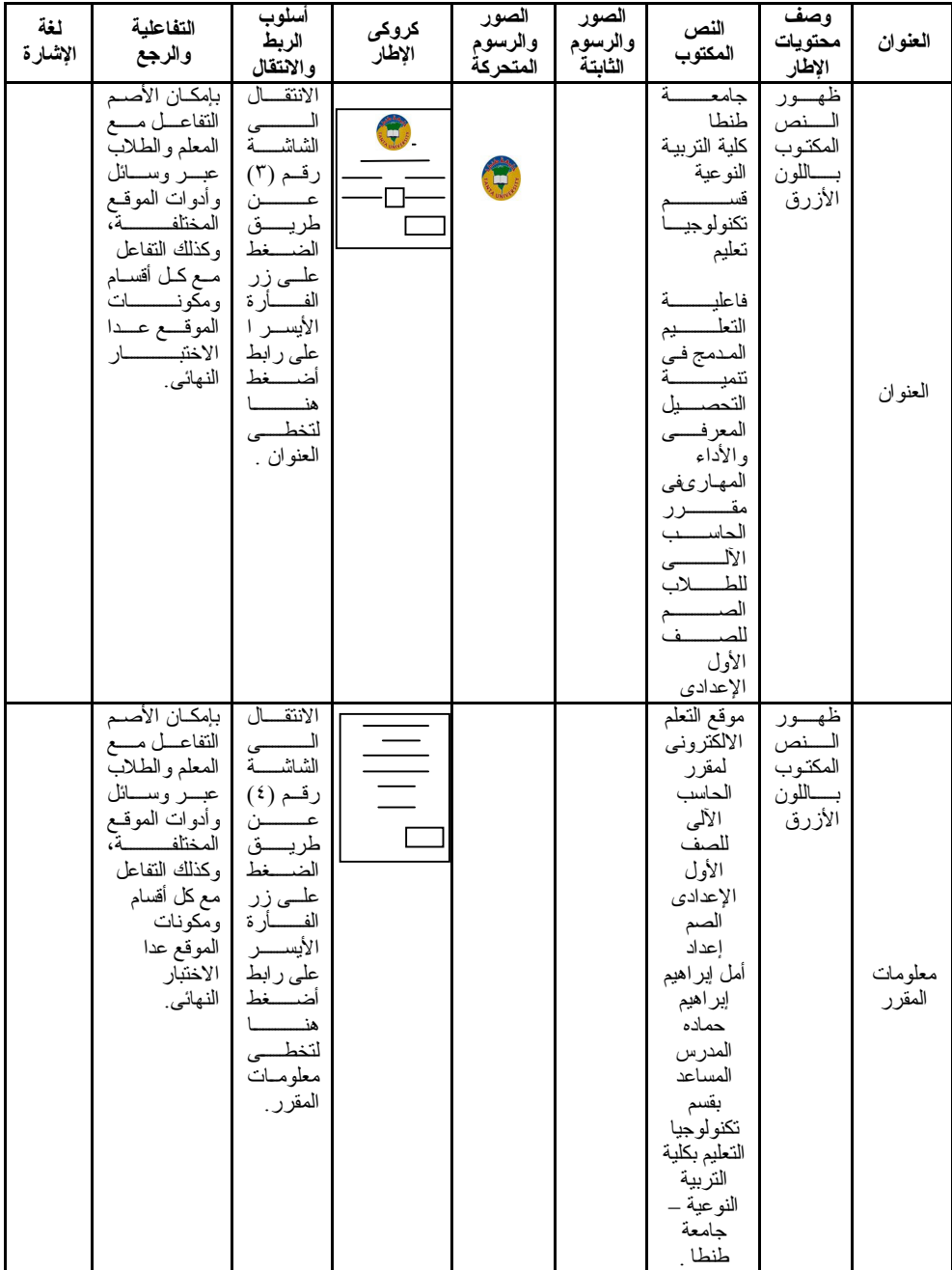
شكل (٤) نموذج لسيناريو تصميم بعض شاشات المحتوى الإلكتروني للصم