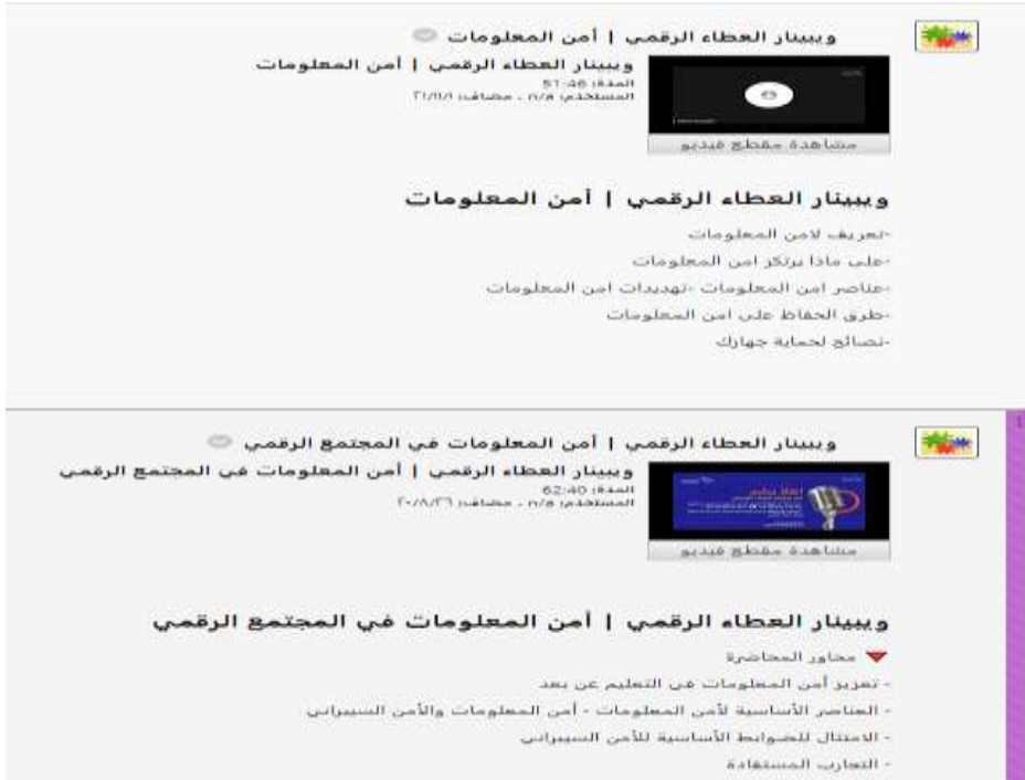
شكل (٢) يوضح جانب آخر من مقاطع الفيديو وروابط قنوات يوتيوب YouTube التي تم إضافتها في صفحة المقرر على البلاك بورد.