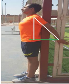
شكل (٣) يوضح اداء اختبار مرونة الكتف

- مواصفات وشروط اختبار مرونة مفصل الكتف: