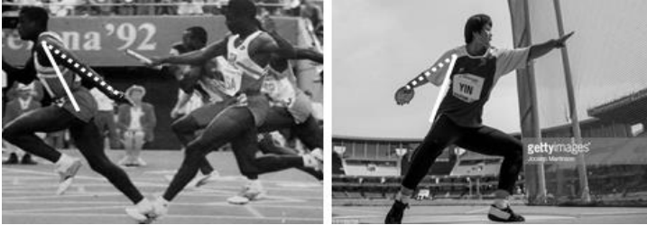
شكل (١) يوضح حركة مفصل الكتف لدى لاعبي قذف القرص ولاعبي سباقات التتابع

المرجات قبل مرحلة الدوران وكذلك لاعب التتابع لاستلام العصا بسهولة والشكل (١) يوضح ذلك، وقد وجد الباحث ان اختبارات المرونة المتداولة تقوم بحساب الدرجة للمختبرين وفقا للدرجات الخام فقط دون مراعاة المقاييس الانثروبومترية للمختبرين الامر الذي يخل بمبدأ تكافؤ الفرص بين المختبرين. لذا قام الباحث بهذه الدراسة للبحث في امكانية تصميم اختبار لقياس مرونة حركة بسط مفصل الكتف على المحور العرضي والمستوى السهمي وتقنين الاختبار باستخدام المعيار المطلق ومراعاة المعاملات العلمية التي يمكن من خلالها أن يصبح هذا الاختبار ضمن قائمة الاختبارات البدنية. ويتم استخراج قيمة الدرجة المعيارية المطلقة باستخدام النموذج الحسابي والذي يعرفه أحمد خفاجي (٢٠١٢م) بأنه "محاكاة الأداء الرياضي بدلالة الطول أو الوزن أو كلاهما ومتغيرات الحركة واخضاعها لنموذج حسابي يساعد في فهم تلك الحركة والتحكم فيها". (٢: ٥)