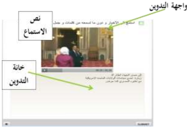
صور من درس الاستماع التفاعلي