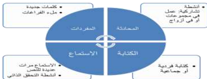
الشكل ٣: درس الاستماع التفاعلي والتعلم المدمج

تم نشر محتوى الدرس على المنصة التفاعلية "مودل" حيث تم استخدام وحدات النشاط المدمجة مع "مودل" بالإضافة إلى أدوات أخرى مثل: "أرنيكولات" و "فلاش" و "أدوب الاختباري" و "الفوتوشوب". تم تسجيل جميع المحتويات والإجابات الممكنة. عند تصميم هذا الدرس، تم تقسيم المهارات إلى تلك التي تُدرّس في الصف، وتلك التي كان الطلاب مسؤولون عن تعلمها عبر الشابكة.