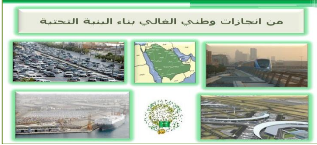
شكل رقم (3) صور لبعض إنجازات الوطن