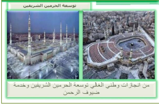
شكل رقم (1) صور لإنجازات الوطن في خدمة الحرمين الشريفين

لفرح الوطن، ويتمثلها ليشارك في بناءه ورفعته والدفاع عنه، وفيما يلي توضيح لبعض القيم في هذا المجال، والتي تساعدك على التعرف عليها بشكل أكاديمي دقيق، ومن ثم تعزيزها وتمثلها بها . الوطن : هو المكان الذي ينتمي إليه الفرد بالولادة أو النشئة أو الوراثة والذي يمثل جزء من هويته الرسمية.