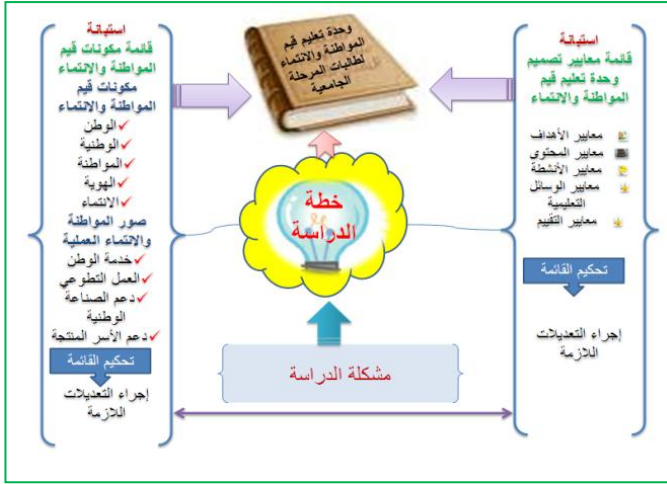
شكل رقم (1): خطة الدراسة

ويوضح الشكل التالي خطة الدراسة الحالية :