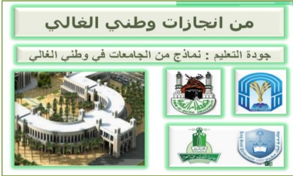
شكل رقم (2) نماذج من الجامعات السعودية