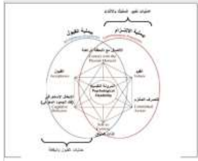
(شكل يوضح فنيات وأساليب العلاج بالقبول والالتزام) (رزق، ٢٠٢٢)