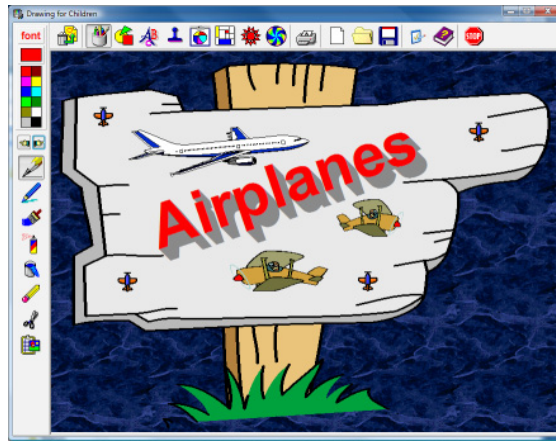
الصورة رقم (١)

الشاشة الرئيسة لبرنامج Drawing for Children وبعض ما يحتويه من أدوات رسم وصور