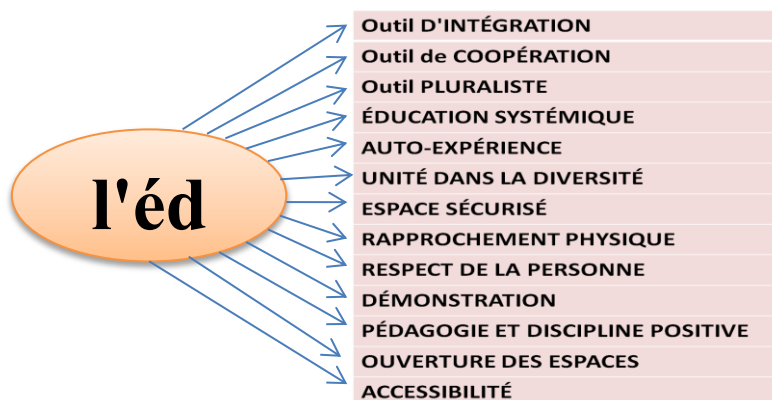
La figure (04) les principales éthiques de l'éducation émotionnelle

L'éducation émotionnelle reconnaît les individus dans leur unicité et facilite leur intégration dans la collectivité à laquelle ils appartiennent (famille, école, institution, entreprise, Commune, région, pays et monde). Proposant des outils de communication et d'harmonie relationnelle, l'éducation émotionnelle se veut être un outil de promotion de la paix, d'une coopération accrue entre les individus et les peuples, à l'opposé du chacun pour soi, elle est pluraliste et non-confessionnelle. Personne ne peut se l'approprier. Elle n'appartient à aucun groupe et ne suit aucun enseignement en particulier. Tout ce qui est susceptible de rencontrer ses objectifs est bienvenu. Elle vise à recadrer tout processus d'éducation, d'enseignement ou de développement de la personne dans une approche systemique , holistique et équilibrée. L'éducation émotionnelle fait des propositions, présente des outils, des stratégies d'apprentissage, de connaissance de soi, de communication. Elle invite à expérimenter , à voir, à exprimer, à comprendre, à faire des choix, à assumer ses choix... elle dénonce toute intolérance, tout extrémisme quel qu'il soit. Elle prône le pluralisme, le rassemblement, l'unité dans la diversité . L'éducation émotionnelle se doit d'offrir